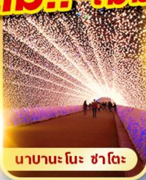
นาฮานะ โนะ ซาโตะ