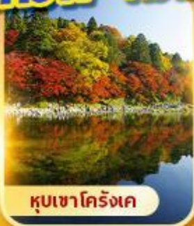
คุบเซาโคริงเค