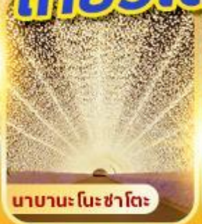
นาคานะ โนะ ซาโตะ