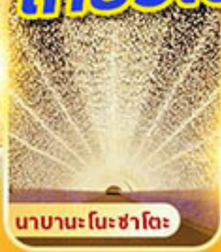
น้ำบานะโนะซาโตะ