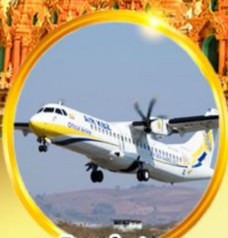
บินภายใน 1 ชม