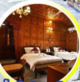
บ้านเรือ..วิมานบนดิน