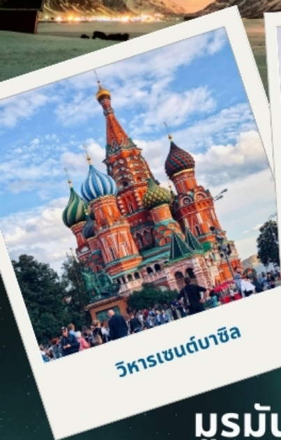
วิหารเซนต์บาซิล

เจาะลึกแสงเหนือ มูร์มันส์ - เทอริเบอก้า - ก็รอฟสค์