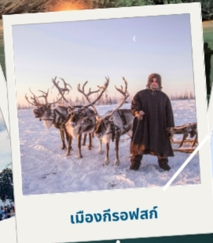
เมืองก็รอฟสค์