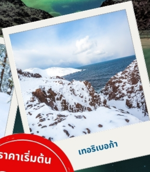
เทอริเบอก้า