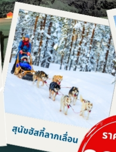
สุนัขฮัสกี้ลากเลื่อน