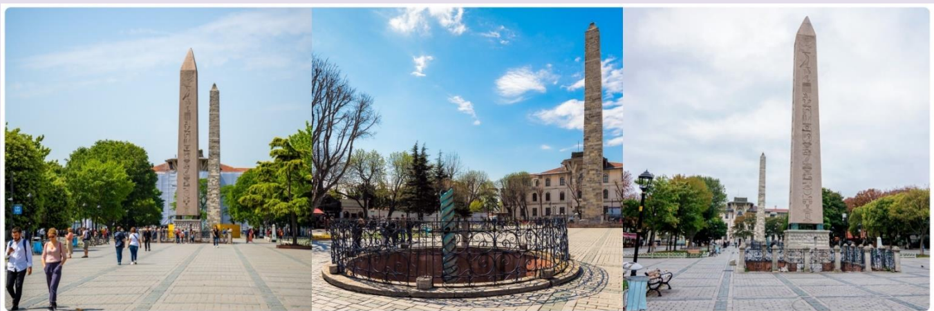
หน้า 14 (ภาพใช้เพื่อการโฆษณาเท่านั้น)

จากนั้นนำทุกท่านสู่ จัตุรัสสุลต่านอะห์เมตหรือฮิปโปโดรม (HIPPODROME) สนามแข่งม้าของชาวโรมัน จุดศูนย์กลางแห่งการท่องเที่ยวเมืองเก่า สร้างขึ้นในสมัยจักรพรรดิ เซปติมิอุสเซเวรุสเพื่อใช้เป็นเวทีแสดงกิจกรรมต่างๆของชาวเมือง ต่อมาในสมัยของจักรพรรดิคอนสแตนตินฮิปโปโดรมได้รับการขยายให้กว้างขึ้นตรงกลางเป็นที่ตั้งแสดงประติมากรรมต่าง ๆซึ่งส่วนใหญ่เป็นศิลปะในยุคกรีกโบราณในสมัยออตโตมันสถานที่แห่งนี้ใช้เป็นที่จัดงานพิธีแต่ในปัจจุบันเหลือเพียงพื้นที่ลานด้านหน้ามัสยิดสุลต่านอะห์เมตซึ่งเป็นที่ตั้งของเสาโอเบลิสค์ 3 ต้น คือเสาที่สร้างในอียิปต์เพื่อถวายแก่ฟาโรห์ทุตโมซิสที่ 3 ถูกลากกลับมาไว้ที่อิสตันบูลเสาต้นที่สอง คือ เสาสูง และเสาต้นที่สาม คือเสาคอนสแตนตินที่ 7