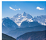
ภูเขาหินปะปี้หม่าง