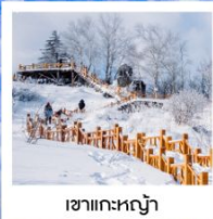
เขากระหลว้า