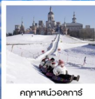
คฤหาสน์วอลการ์