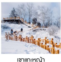
เซาเทะหญา

ฟรี!! ...ถุงมือ ผ้าพันคอ หมวก ท่านละ 1 ชุด