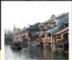
เมืองโบราณผานหลงกุ้เจิน