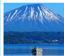
ค่องเรือทะเลสาบโทยะ