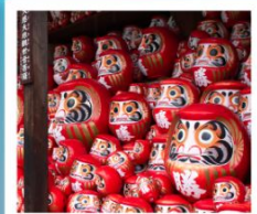
วัดคิตสึโอจิ