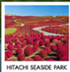
HITACHI SEASIDE PARK