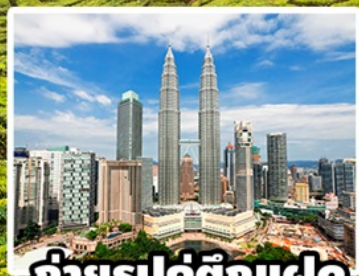
ถ่ายรูปคู่ตึกแฝด