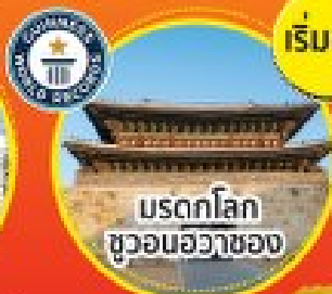
มรดกโลก ชวอนฮวาซอง