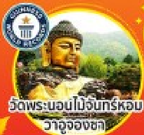
วัดพระบอมนโง่นทร์หอม วาจุงองชกา