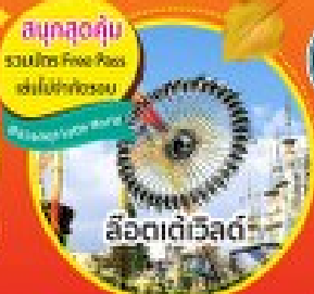
สวิตเตเวิลด์