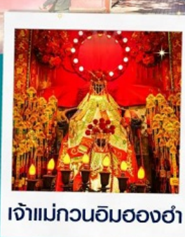
เจ้าแม่กวนอิมฮ่องฮ่า