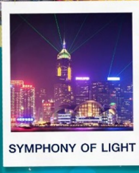
SYMPHONY OF LIGHT