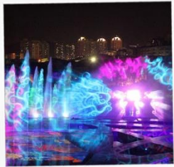
โชว์ม่านน้ำสามมิติ OCT BAY WATER SHOW