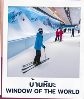
บ้านหิมะ WINDOW OF THE WORLD