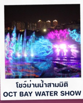
โชว์ม่านน้ำสามมิติ OCT BAY WATER SHOW