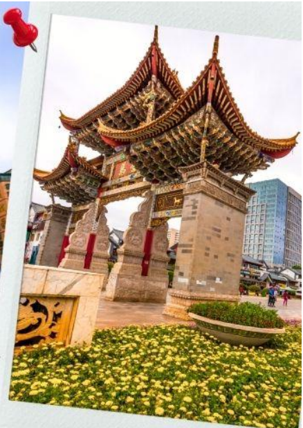
ประตูม้าทองไก่หยก Golden Horse Jade Cock Gate

เที่ยง ☉ รับประทานอาหารกลางวันที่ภัตตาคาร (14) เมนูพิเศษ สุกี้เห็ดไก่อดำ