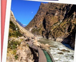
ช่องแคบเสือกระโจน รวมบันไดเลื่อน ขึ้น-ลง