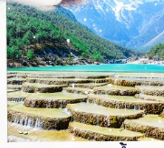
ทะเลสาบธารน้ำขาว รวมรถแท็กซี่