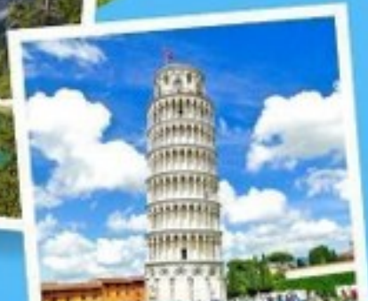
เมืองปิซ่า