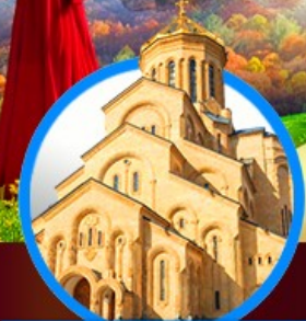
โบสถ์กรินดี เมืองทบิลีซี