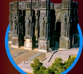
อนุสาวรีย์ประวัติศาสตร์

48,888 23-28 ต.ค. 67 เหลือ 10 ที่ 41,111