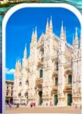
DUOMO MILAN ITALY