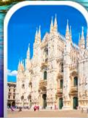
DUOMO MILAN ITALY