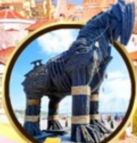
น้ำไม้เมืองทรอย