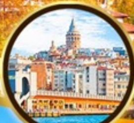
หอคอยกาลาตา