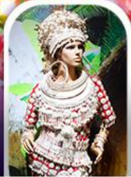
หมู่บ้านชนเผ่า