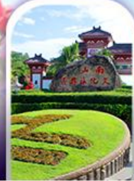
อุทยานหนานชาน