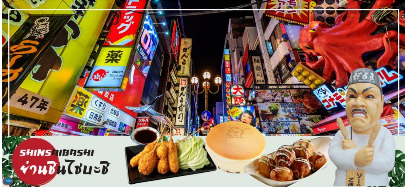
เย็น รับประทานอาหารเย็นอิสระตามอัธยาศัย

อิสระช้อปปิ้ง ย่านชินไซบาชิ (Shinsaibashi) บริเวณแหล่งช้อปปิ้งแห่งนี้มีความยาวประมาณ 600 เมตร เต็มไปด้วยร้านค้าปลีก ร้านแฟชั่นร้านเครื่องสำอางค์ ร้านรองเท้า กระเป๋า นาฬิกา ร้านกาแฟ ร้านอาหาร ร้านขนม ร้านเสื้อผ้าสตรีทแบรนด์ทั้งญี่ปุ่นและต่างประเทศ เช่น Zara H&M Beans ABC Mart เป็นต้น เรียกว่ามีทุกอย่างที่ต้องการรวมกันอยู่บริเวณนี้ ใกล้กันท่านสามารถเดินไปยัง ย่านโดทงโบริ (Dotonbori) ย่านบันเทิงยามค่ำคินดอลอดแนวถนนเลียบบคลองโดทงโบริ จากสะพานโดทงโบริบาชิไปจนถึงสะพานนิปปอนบาชิ ไฮไลท์!!! ใครๆ ก็เช็กอิน ถ่ายภาพคู่ ป้ายกูลิโกะแมน หรือ ป้ายโดทงโบริกูลิโกะ (Dotonbori Glico Sign) เป็นป้ายไฟนีออนรูปนักกรีฑากำลังวิ่งอยู่บนลู่วิ่ง ซึ่งถูกติดตั้งมาตั้งแต่ ปี ค.ศ.1935 นอกจากนี้ยังมีอีกหนึ่งสัญลักษณ์สถานที่นัดพบกันหลง นั่นก็คือ ร้านปูคานิดอรากุ (Kani Doraku) ซึ่งมีปูยักษ์ขยับแขนและลูกตาได้อีกด้วย และห้ามพลาดสำหรับทาโกะยากิ อาหารท้องถิ่นของชาวโอซาก้า ที่มาถึงถิ่นแล้วต้องลอง Original Taste รับรองไม่ผิดหวังแน่นอน