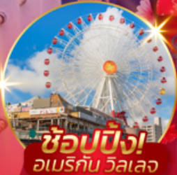
ช้อปปิ้ง! อเมริกัน วิลเลจ