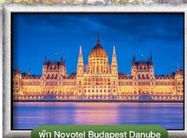
พัก Novotel Budapest Danube