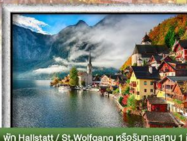
พำนัก Hallstatt / St. Wolfgang หรือริมนทะเลสาบ 1 คืน

พิเศษ!! ลิ้มลองเมนูประจำชาติ ทั้ง 5 ประเทศ!!!