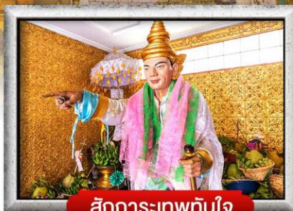
สักการะเทพทันใจ