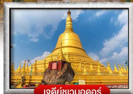
เจดีย์ชเวมอดอร์

เมนู สุดพิเศษ | กุ้งแม่น้ำเผา + บุฟเฟ่ต์นานาชาติ