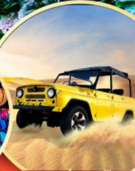
ฟรี! นั่งรถจี๊ป