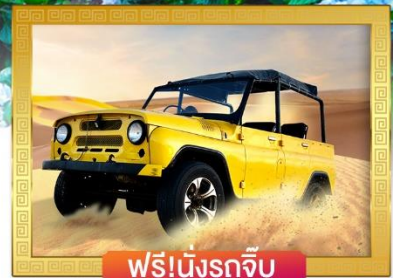
ฟรี!นั่งรถจี๊ป

เดินทางโดยสายการบินเวียดนามแอร์ไลน์ อาหาร : 9 มื้อ โรงแรม : 3-4 ดาว