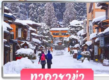
ทาคายามา