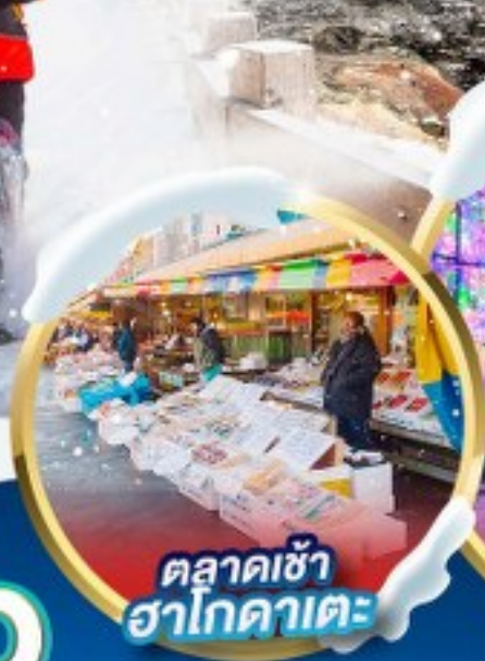
ตลาดเช้า ฮาโกดาเตะ