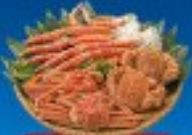
พิเศษ! ว่าง 3 อดิ