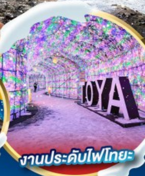
งานประดับไฟไทยะ