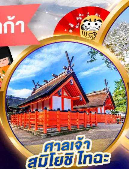
ศาลเจ้า สุมิโยชิ ไทระ

ชมความยิ่งใหญ่เทศกาลประดับไฟ นาบานาโนะ ซาโตะ สัมผัสหมู่บ้านทรงกัสซุ ณ หมู่บ้านชิราคาวาโกะ เที่ยวครบทุกวัน ไม่มีวันอิสระ