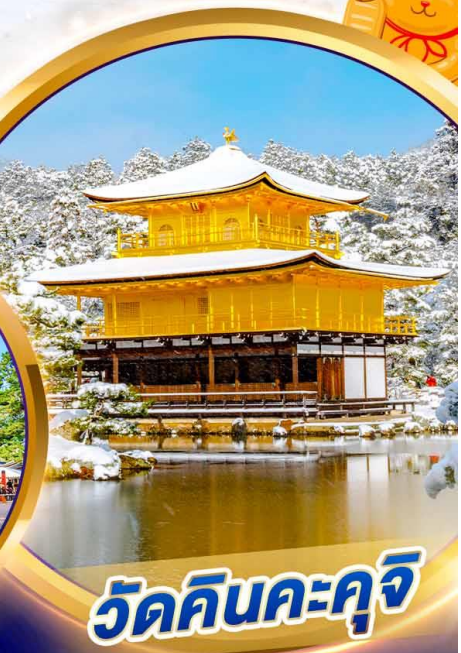
วัดคินคะคุจิ