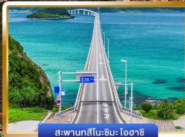
สะพานสึโนะชิมะ-โอฮาชิ