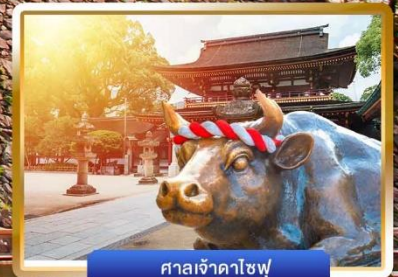
ศาลเจ้าดาไซฟุ