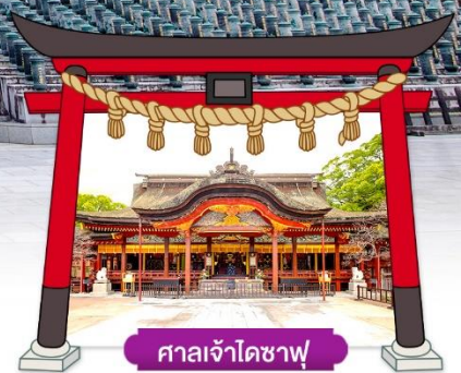
ศาลเจ้าโดซาฟุ