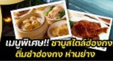
เมนูพิเศษ!! ซามุสโตสต์ฮ่องกง ติ่มซำฮ่องกง ห่านย่าง