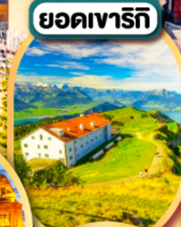
ยอดเขารีกิ