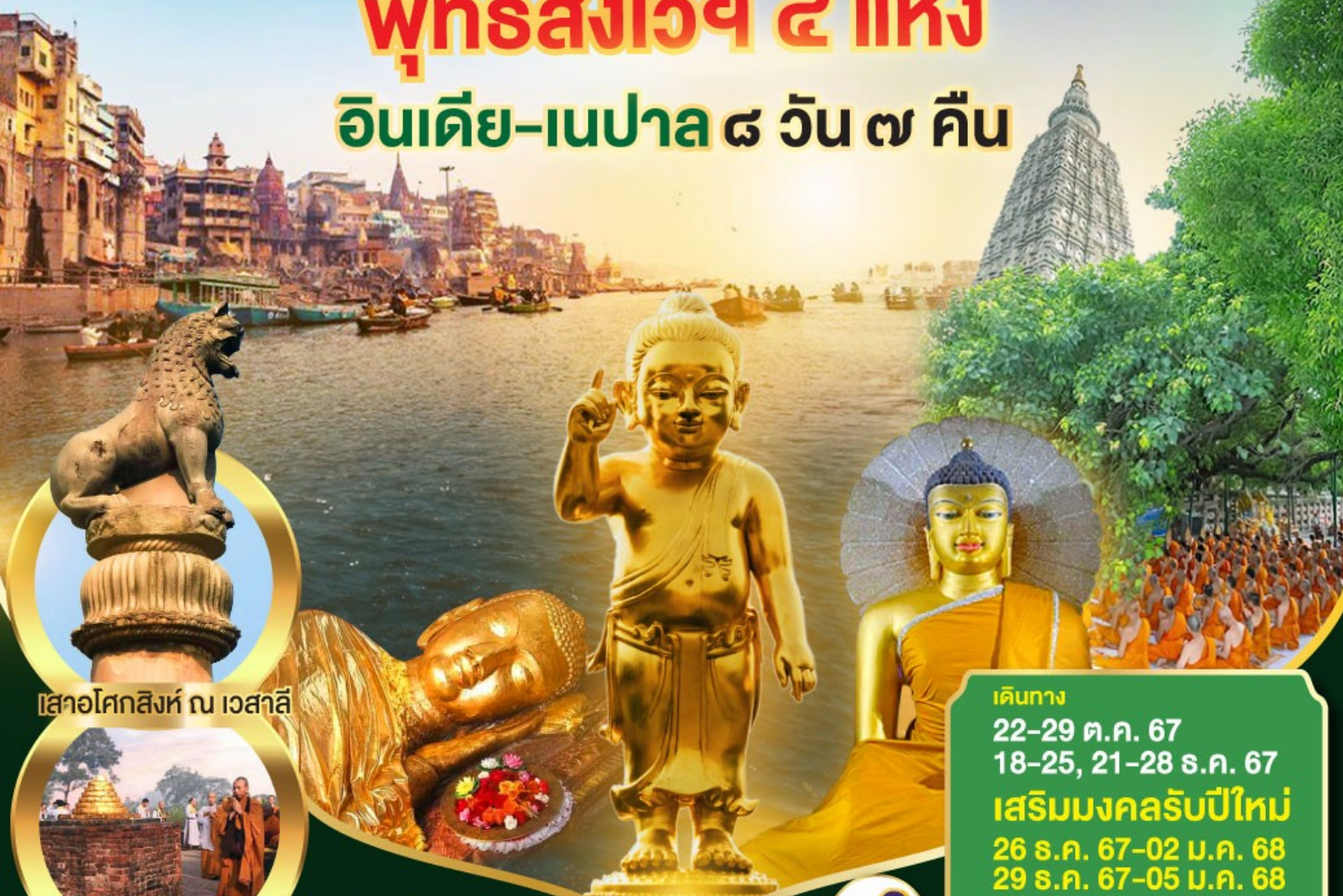
เสาอโศกสิงห์ ณ เวสาลี