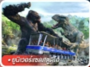
ยูนิเวอร์สไอส์แลนด์