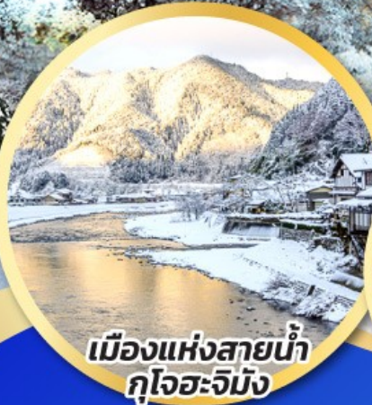
เมืองแห่งสายน้ำ กุโจะ-จิมัง