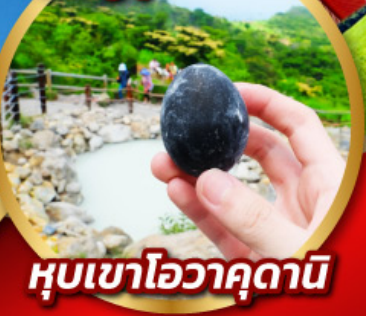
หุบเขาโอวาคุดานิ