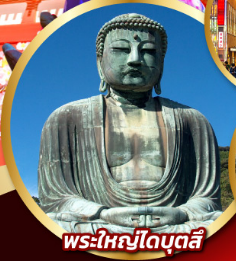
พระใหญ่โตบุตสึ