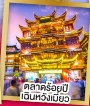
ตลาดร้อยปี เงินหวังเมี่ยว