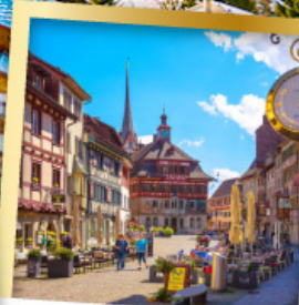
ชไตน์ อัม โรน