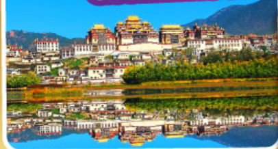
วัดลามะชงจ้านหลิง