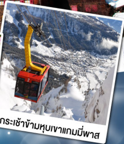
กระเช้าข้ามหุบเขาแกมมีพาส

18-24 ก.พ. 68 11-17 มี.ค. 68 29 เม.ย.-05 พ.ค. 68