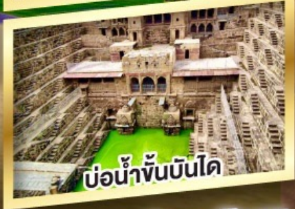
บ่อน้ำขั้นบันได