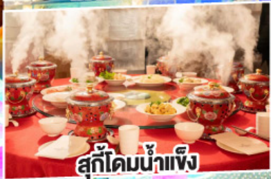
สุกี้ไคมน้ำแข็ง