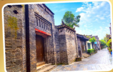
ถนนคนเดินชอยกว้างชวยแคบ