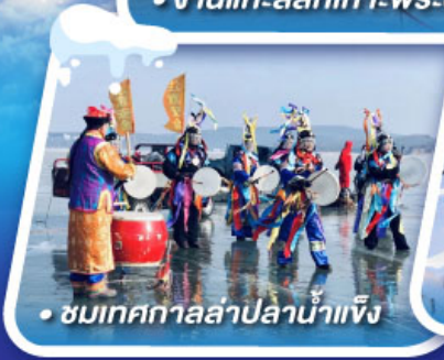
• ชมเทศกาลล่าปลาน้ำแข็ง