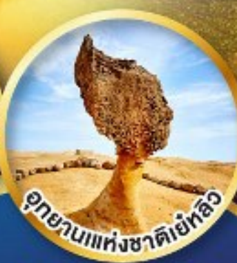
อุทยานแห่งชาติเย่หลิว