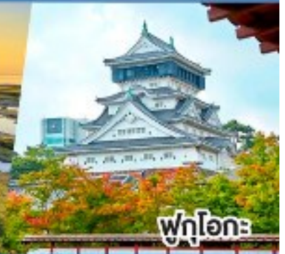
ฟูกูโอกะ