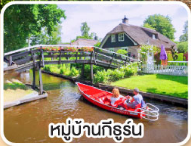
หมู่บ้านกังธูร์น