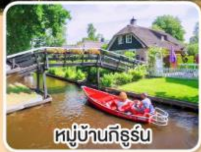
หมู่บ้านกีร์รุ่น