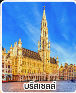
บรัสเซลส์