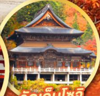
วัดเอ็นโซจิ

กิจกรรมเก็บผลไม้ พักออนเซ็น 2 คืน พักโรงแรมในโตเกียว 2 คืน