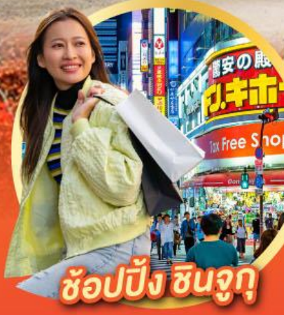
ช้อปปิ้ง ซินจูกุ