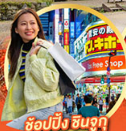
ช้อปปิ้ง ซินจูกุ

นั่งกระเช้าชมวิว ใบไม้เปลี่ยนสี Mt.Adatara