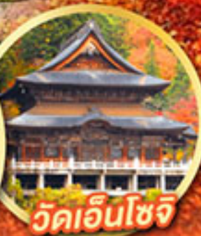
วัดเอ็นโซจิ

กิจกรรมเก็บผลไม้ พักออนเซ็น 2 คืน พักโรงแรมในโตเกียว 2 คืน